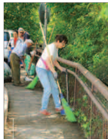
Organizzato dagli Amici di via delle Cave l'intervento è durato cinque ore